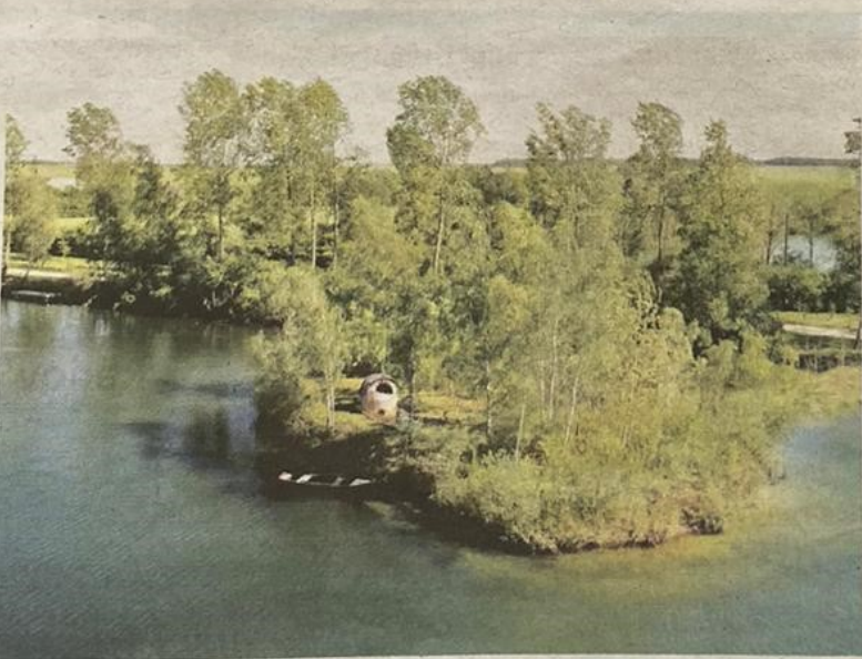
Plusieurs bulles étoilées sont situées sur une île, coupées du monde pour une intimité garantie !

■ Tarif : 149 € la nuit avec petit déjeuner. Activités sur le domaine : croisière sur la Seine, coach sportif, balade guidée en paddle ou en canoë-kayak, randonnée et visite de la volière. Renseignements : www.etangsdela-bassee.com