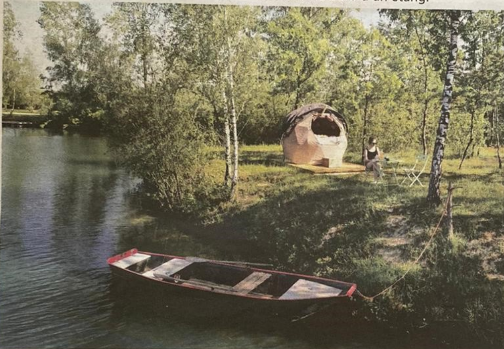
Nous avons pu passer une nuit dans la bulle « Rubis », équipée d'un salon de jardin et d'une barque

Au sud de la Seine-et-Marne, les Etangs de la Bassée proposent des logements insolites en bulle étoilée. L'occasion de passer une nuit au bord d'un étang.